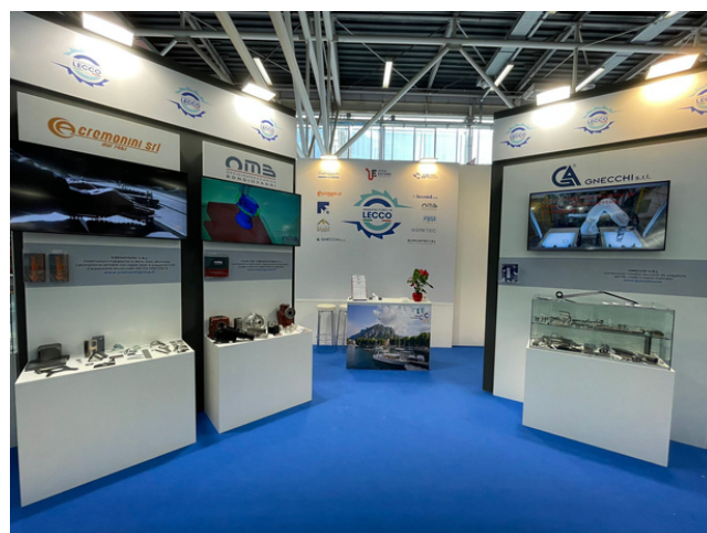
POSTAZIONE SINGOLA (La foto è esemplificativa e risale alla scorsa edizione di MECSPE BOLOGNA 2023)